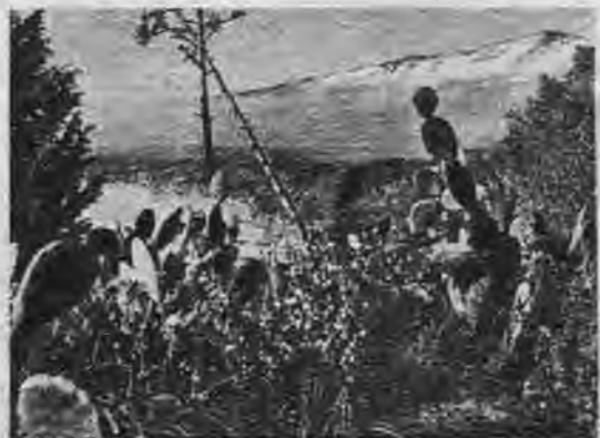
Bagātīga veģetācija, gleznainas jūras fiču piekrastes un kalnu grēdas, kas paceļas līdz mūžīgajai sniega joslai, piešķir Sicilijai raksturīgu Vidusjūras salu skaistumu.