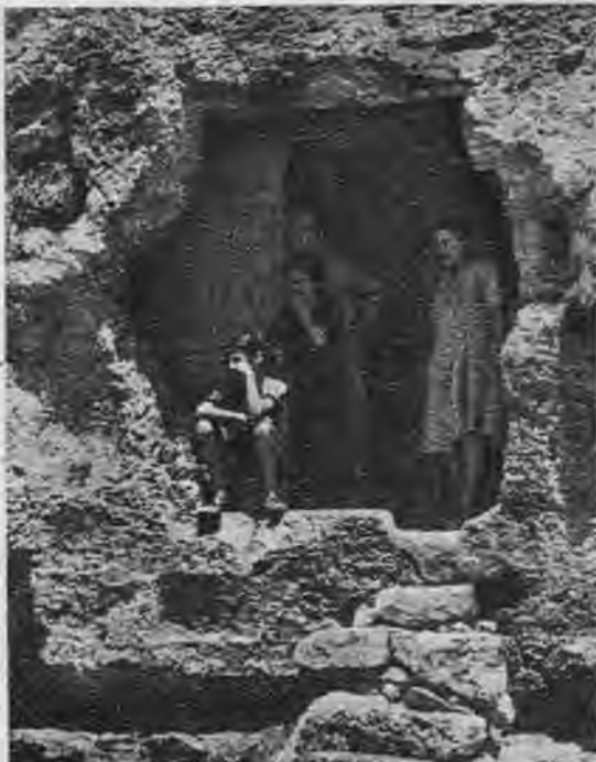
Iebrukumam Sicilijā sākoties, vairums iedzīvo tāju atstāja savas dzīves vietas, lai meklētu drošu patvērumu klinšu aļās.