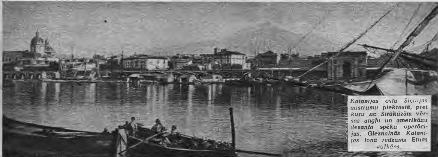
Katanijas osta Sicilijas austrumu piekrastē, pret kuru no Sirākūzām vējšas angļu un amerikāņu desanta spēku operācijas. Gleznainās Katanijas fonā redzams Etnas vulkāns.