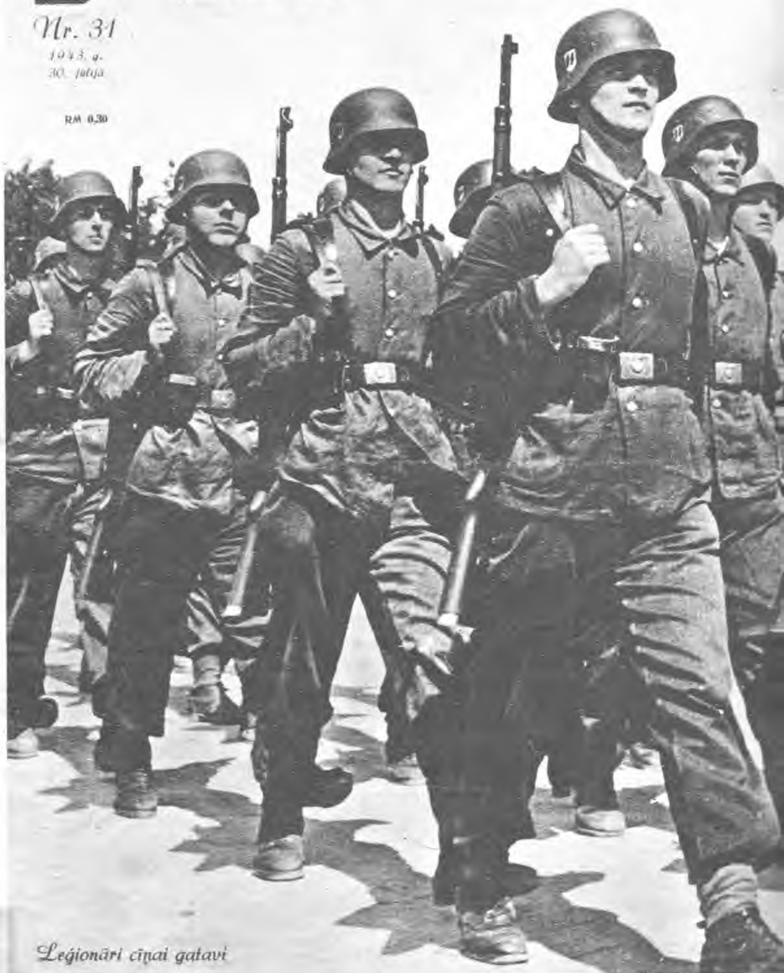
Leģionāri cīņai gatavi