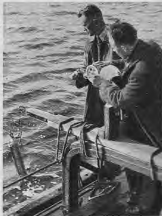
Baloms — aparāts jūras ūdens paraugu ņemšanai — sagatavots nolaišanai dziļumā

„Rīgas jūras līcis,” paskaidro viens no ekspedīcijas vadītājiem, „ir visuntumainākais ūdens baseins, jo šeit 3 lielās un daudzās mazākās upes iepludina ļoti daudz saldūdens, bet tai pašā laikā pa šaurumiem var ieplūst arī daudz jūras ūdens. Blīvumu starpība starp sāļo jūras un upju saldūdeni rada grūti nosakāmas straumes