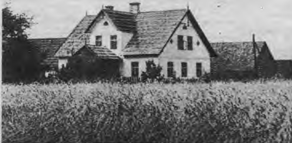
Daudzu paaudžu iekoptās Latvijas druvas ar glitajām dārzos slīgstošajām mājām pārvērst nolaistos kolchozos, kur darbā verdzinātie zemnieki tikko iegūst sev iztiku, — tāds bija bolševiku melīgās politikas gala mērķis.

dzīvotāju šķirām. „Padomju Latvija” 1940. g. 16. augustā raksta: „Jauzver, ka valdība atbalstīs ikvienu godīgu tirgotāju, tāpēc viņiem jāturpina savs darbs.” Bet jau pēc mēneša, 29. septembrī, „Cīņā” lasāms „Dekrēts par tirdzniecības uzņēmumu nacionālizāciju”. Pēc šī dekrēta daudziem tūkstošiem tirgotāju atņēma viņu veikalus ar visām precēm miljoniem latu vērtībā, naudu un tekošiem rēķiniem, bet veikalu parādi un nodokļi bija jāsamaksā pašiem tirgotājiem. Ar kādiem līdzekļiem? — to neviens neprasiņa. Tāds pat liktenis piemē-